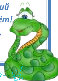
График проведения новогодних праздников

Под тихий, медленный снежок Ступая мягкими шагами, Перешагнув через порог Прошедший год, простившись с нами. Пусть он уходит, так должно быть, Ты ни о чём не сожалей! Уже стучится в двери новый, Так отвори ему скорей! Поверь, что этот год грядущий Исполнит всё, что сердце ждёт! Он непременно будет лучший, Успешный и счастливый год!