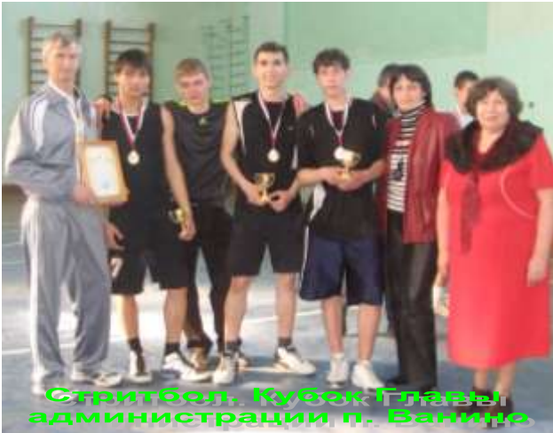
Стритбол. Кубок Главы администрации п. Ванино