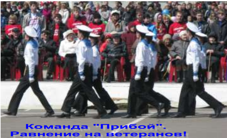
Команда "Прибой". Равнение на ветеранов!