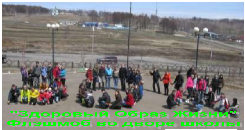
"Здоровый Образ Жизни" Флэшмоб во дворе школы

Вместе на каникулы идем, Нет счастливей нас на свете белом! Будем петь и загорать вдвоем, Отдыхать умом, душой и телом!!!