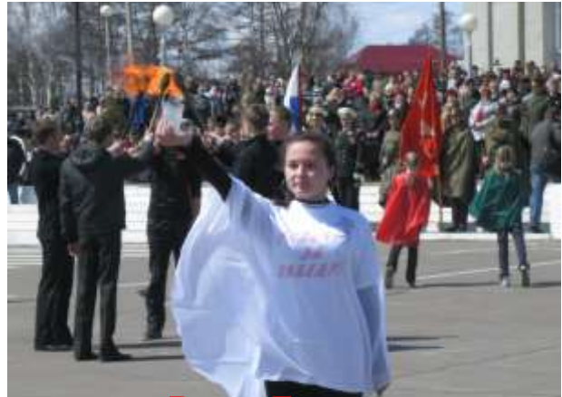
Вахта Памяти. Митинг, посвященный Дню Победы