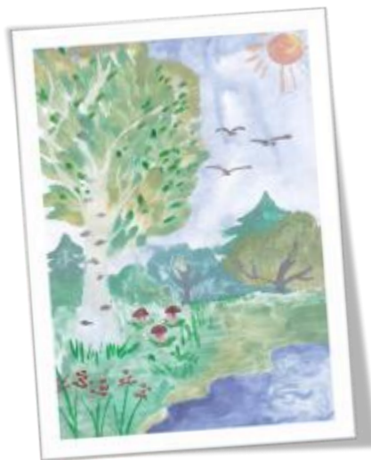
Рис. Сайдашевой Тани

Осипов С.С. 16 класс Я говорю спасибо краю за красивую богатую природу. Я горжусь в крае тем, что здесь Амурские тигры. Я люблю свой поселок Ванино это моя родина. Я говорю спасибо правительству поселка Ванино за любимую тропу.