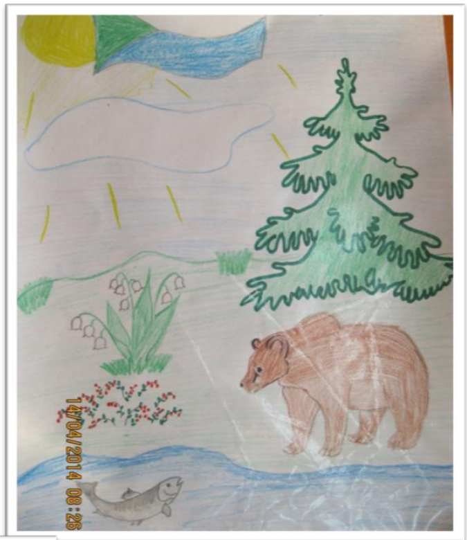
Рис. Михайлюк Дианы