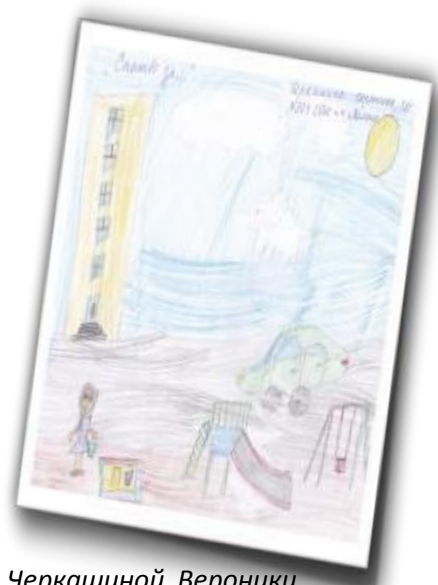
Рис. Черкашиной Вероники

Я говорю спасибо поселку за то, что я учусь в новой красивой школе. Я горжусь в крае тем, что здесь живут добрые и отзывчивые люди. Я люблю свой поселок за море и красивую природу. Я говорю спасибо правительству поселка за любимые спортзалы. 16 класс Визуализация